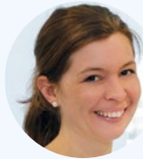
Organisatorische Leitung Barbara Heilmeier